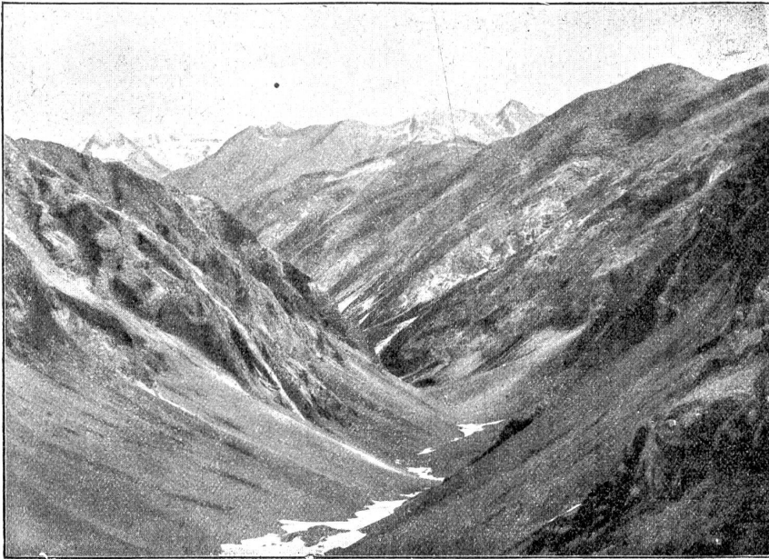
Blick ins Val Cluozza mit Piz del Agua und Piz del Diavel.