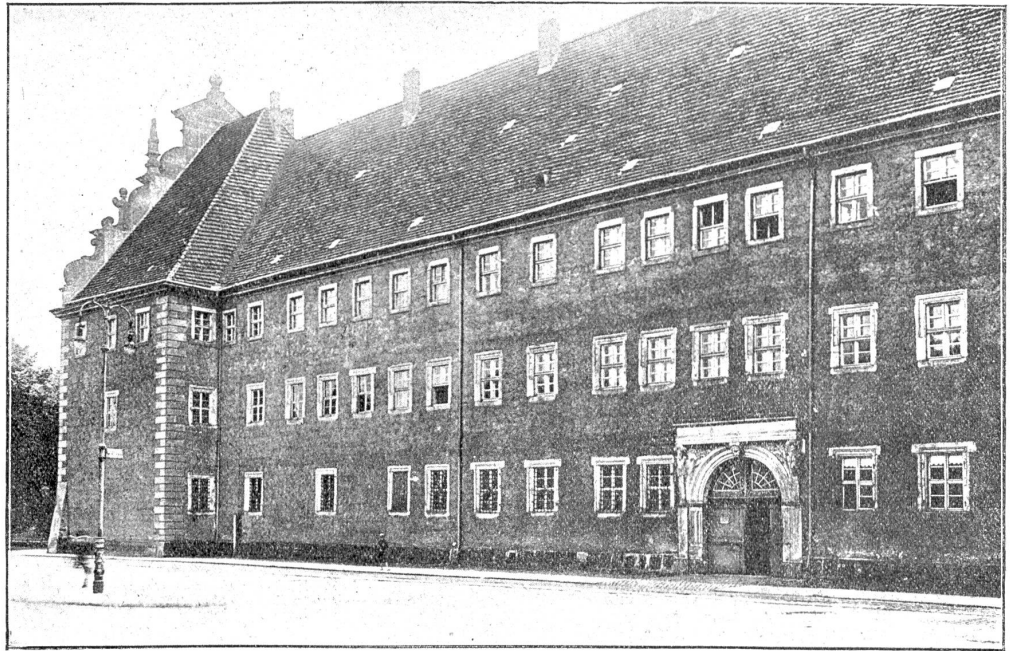
Das „Lutherhaus“ in Wittenberg (das ehemalige Augustinerkloster).

Wegweiser sind sie uns zunächst darin, daß ihr Lebens-