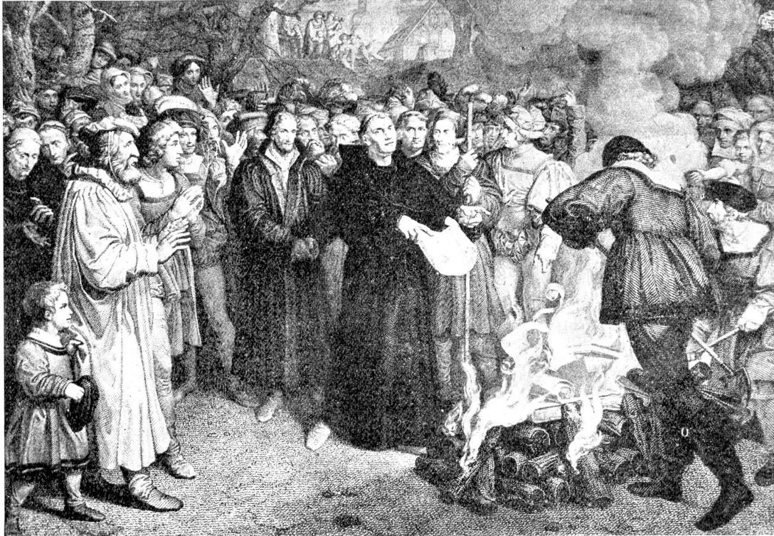
Die Verbrennung der Bannbulle am 10. Dezember 1520.

fachen und Entscheidenden läßt sich in die Worte fassen: Die Reformation zeigt uns einen neuen Ernst des sittlichen Kampfes, des religiösen Suchens und Findens, sie zeigt uns in neuem Lichte unsere Stellung zu Gott und dem Bruder, die Reformation hat uns wiederum an die Gottesoffenbarung in der heiligen Schrift gebunden, sie verkündet und fordert die lebendige christliche Gemeinde, sie hebt den Unterschied auf zwischen Profan und Heilig, indem sie das ganze Leben und Zusammenleben der Menschen als einen Gottesdienst aufgefaßt wissen will. Wir brauchen die von den Reformatoren wiederum auf den Leuchter gehobenen Wahrheiten und Tatsachen nur einen Augenblick gegenwärtig zu halten, so spüren wir schon, wie auch unsere Zeit und wir selber aus diesen Quellen Heilung und Hilfe bekommen würden.