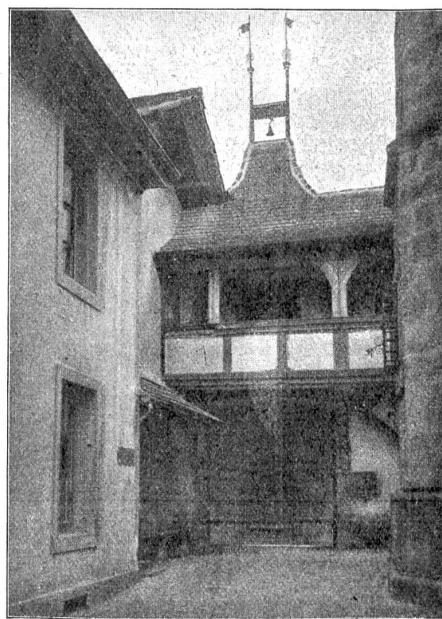
innenseite des Schlosshofes.

weise in ihnen Engel sah. Nun tritt sie in selbständige Aktion. Sie sucht ihre Programmpunkte zu ordnen, stellt sie dem Programm der bisherigen Parteien gegenüber. Und mit schmerzlichem Staunen erklären die bisherigen Führer: „Warum vertraut ihr uns nicht? Warum stellt ihr neue Programme auf? War es anfangs nicht so und so? Warum schwenkt ihr jetzt ab, da ihr doch so fest zu uns standet?“