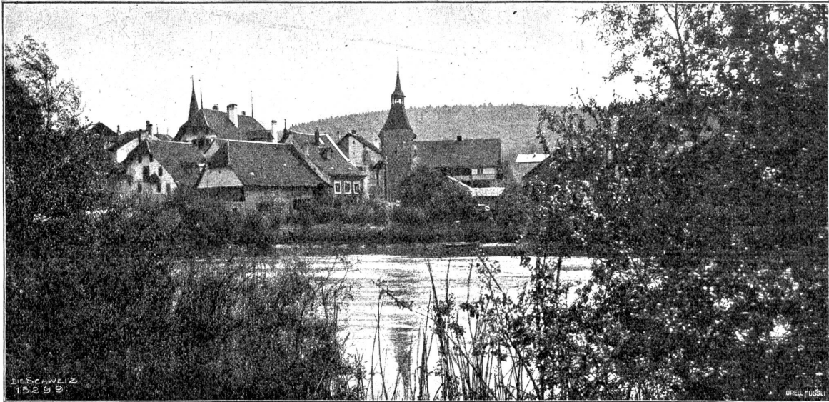
Büren an der Aare.

die industrielle Entwicklung nicht in dem Maße mitmachen, daß ihre ursprüngliche Anlage geprengt und ihre alten Bürgerhäuser ein Opfer der modernen Bautätigkeit geworden wären. Sie zeigen noch unverfälschte alte Fassaden und Grundrisse, und da und dort hat feinfühligste Pietät auch Details, wie Beschläge, Schlösser, Getäfer, Stukkaturen, Gesimseverzierungen, Defen und sogar ganze Zimmereinrichtung aus Urgroßväterzeiten unberührt gelassen. Der „Scharnachtalhof“ und der „Rosengarten“ in Thun, die Rathhäuser in Erlach und Nidau sind gute Beispiele hiefür.