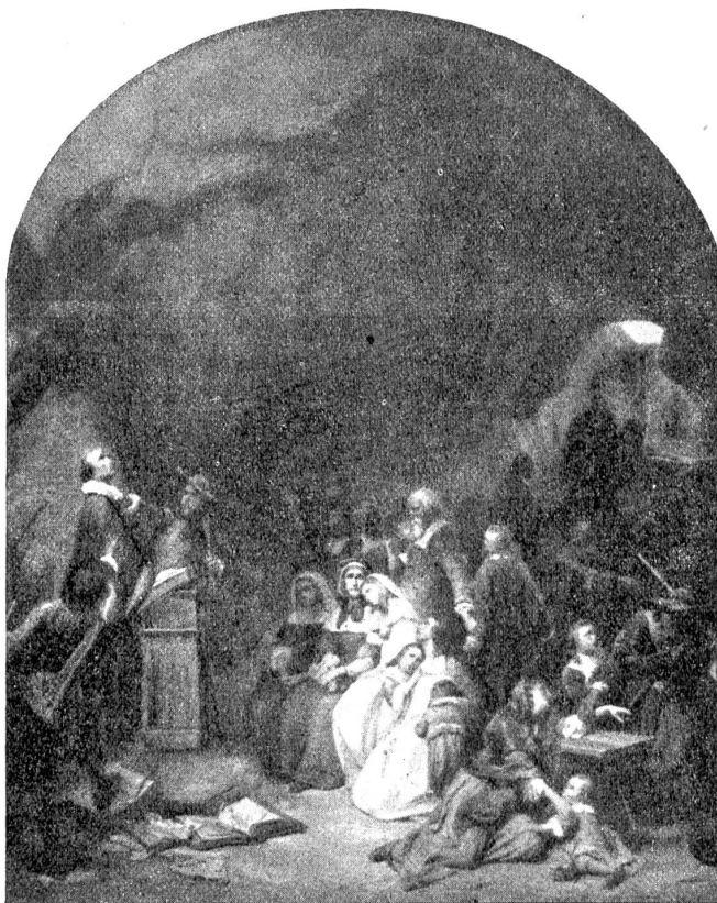
Karl Girardet 1842. Die Hugenotten. (Museum in Neuenburg.)

„Die Gemeinde hat einmal den Steinbruch, so weit man sehen kann, an eine Gesellschaft verkauft. Die beutet sie für Mineralien aus. Beschwächt sind wir worden, um einen Apfelbuzen haben wir das Dolomitengestein hergegeben. Jetzt müssen wir Steine kaufen, als gehörte die Gotteswelt rings herum nicht einem jeden. Und auf Stein muß das Haus stehen, der Stürme und des Schnees wegen. Und dann die Schulbänke, und die Bücher, und der Ofen, und die Lampen und alles andere. Woher nehmen? Laßt halt in Gottes Namen das Gespenst im Schulhaus wüten. Gut, wenn keins mehr da ist von den armen Dingen, im Himmel haben sie's besser. Abbrennen sollte man das Haus, das Mörderhaus, und jedes Dachschindelchen, das herumliegt, hineinwerfen in die Glut, damit das Gerippe samt Krankheit und Tod mitverbrennt.“ Der Mann leuchte und Schweißtropfen rannen ihm über das magere Gesicht.