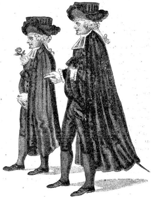
Msgrs. du petit Conseil (mit der Perrüsse, dem höhern Samthut).

dem Schauspiel des Zuges ein ganz eigenes Gepräge eines National- und Volksfests. . . . Aber nun zog es mich doch hin zu dem das Fest krönenden sogenannten Schultheißenmahl. Als ich mich mit meinen Freunden gegen 9 Uhr auf dem Gesellschaftshause zu Gerwern einfand, wo die Mahlzeit stattfinden sollte, da war der große Speisesaal bereits so gedrängt voll, daß wir keine Plätze mehr am Tische