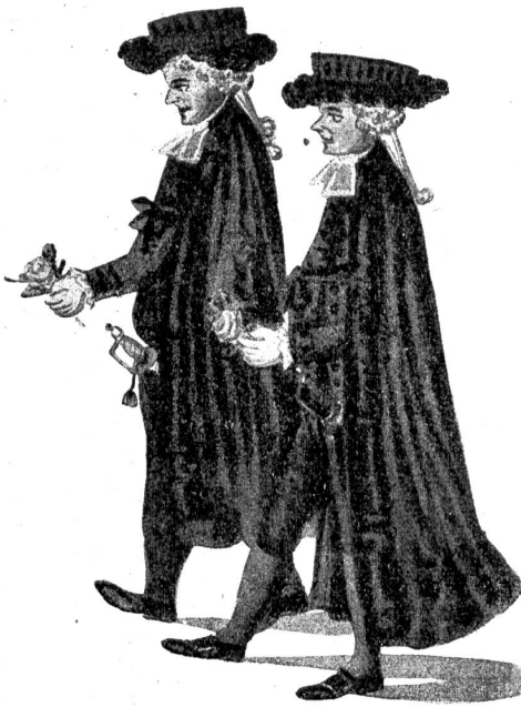
MSgrs. du Grand Conseil ou les Deux Cents (mit dem Barett, dem niedrigen Samthut).

herben geströmt, um der Sitte der Väter treu zu bleiben. Da der Schultheiß und die Häupter im großen Speisesaal