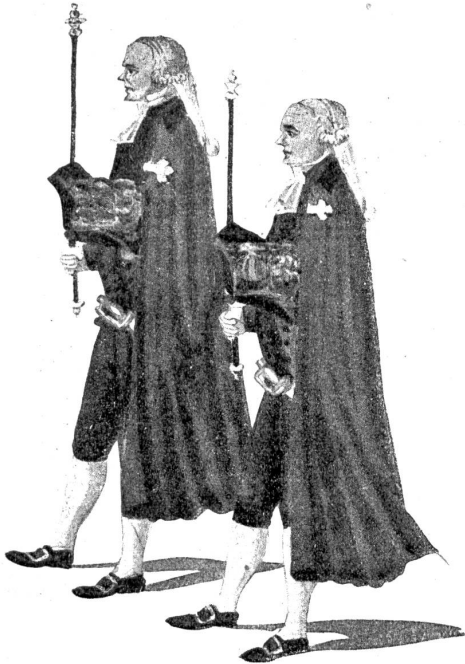
Officiers d'Etat. (Beamte, welche die Hüte der Schultheißen tragen.)

Ich. Ich will ech Bürg derfür se, daß der Man recht braf traktieren wird. — Sust wenn er's nüt thuet, so haltet ech derfür a miß.