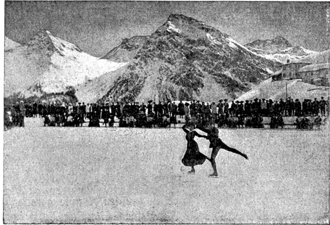
Eisläufer in Arosa.

Das sechste Schweizerische Mobilisationsanleihen darf als ein glänzendes Zeugnis des Schweizervolkes gewertet werden, dem Staat die nötigen Mittel zur Aufrechterhaltung der Neutralität zur Verfügung zu stellen. Es wurden im ganzen Fr. 139,154,600 gezeichnet. —