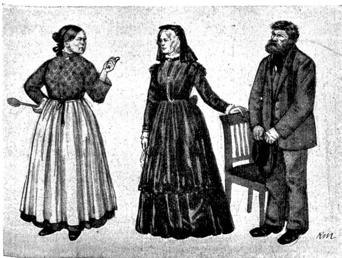
Skizze von Rud. Minger für die Gruppe: Mädli, Frau von Lentulus und Madörli in „Der Rapolitaner“ von O. v. Greyerz.