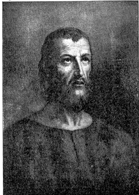
Zur 500. Gedenkfeier an Niklaus von der Flüe (21. März 1417-1917). Niklaus von der Flüe (Bruder_Klaus) geb. in Sachjeln am 21. März 1417.