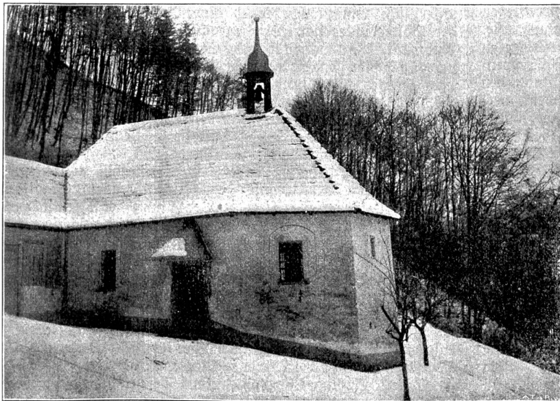
Zur 500. Gedenkfeier an Niklaus von der Flüe (21. März 1417-1917). Die Bruder Klaus Kapelle im Ranft bei Sühli.

daß der Schweizer als Schweizer bei diesem Krieg, bei dem Krieg überhaupt keine andern Sympathien als all-gemein-menschliche zu verschenken hat. Wir wissen, daß mit diesem Kriege der Krieg als Kultureinrichtung aus der Welt verschwinden muß. Und dabei heißt es auf der ganzen Linie umlernen. Dieses Umlernen wird neue Probleme in die Welt stellen; sie sind zum Teil schon da und fordern dringend der Lösung. Es sind nicht mehr Rechts-fragen in gemeinpolitischem Sinne, es sind Fragen der Gerechtigkeit im weitesten Sinne des Wortes. Um diese Fragen wird in den nächsten Zeiten in unserem Vaterland der Kampf entbrennen. Möge dann der milde Geist der Versöhnlichkeit, des gegenseitigen Vertrauens und des guten Willens, den uns Niklaus von der Flüe gelehrt, über dem Schweizerlande walten.