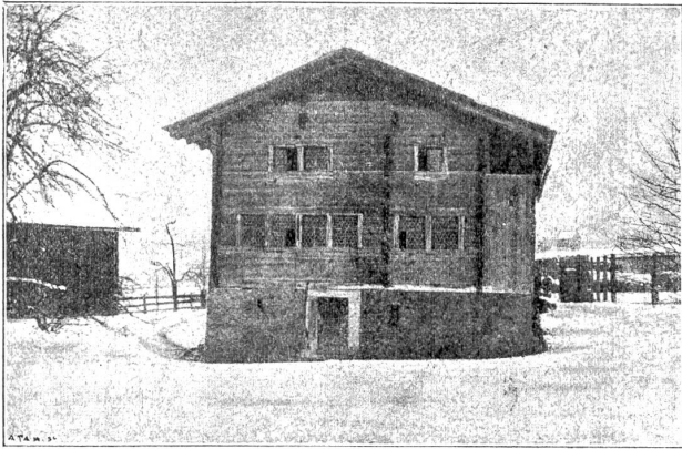
Zur 500. Gedenkfeier an Niklaus von der Flüe (21. März 1418-1917). Das Geburtshaus Niklaus von der Flüe in Klühli bei Sachseln.

ins schöne Talgelände am Sarnensee locken wird. Eine kurze historische Würdigung der Gestalt des frommen Ein-