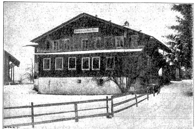
Zur 500. Gedenkfeier an Niklaus von der Flüe (21. März 1417-1917). Das Haus, in dem Niklaus von der Flüe bis zum 50. Altersjahr wohnte.

Der tolle Freischarenzug jener raub- und rauflustigen 2000 Bursche vom „thorechten Leben“, die im Januar 1477 die Städte Luzern, Bern, Freiburg und Genf brandschakten, hatte eine gereizte Stimmung der Städte gegen die Länder-Kantone erzeugt, in deren Gemarckung der „Saubannerfeldzug“ seinen Anfang genommen, ohne daß die Regierungen dagegen eingeschritten wären. Die Städte sahen sich in ihrer Sicherheit bedroht und schlossen unter sich das „ewige Burgrecht“, eine Antwort zugleich auch auf das Bündnis, das die Länder-Orte mit dem Bischof von Konstanz geschlossen entgegen der Abmahnung der andern Stände. Nun erhoben die Länder, die sich nun ihrerseits