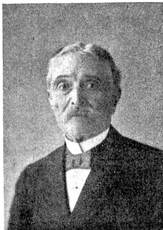
† Ernest Guibal.

Guibal machte als Artillerist auch den Krimkrieg und die furchtbare Schlacht bei Solferino mit. 1870 wurde er zum Wachmeister in der unglücklichen Bourbaki-Armee befördert und kam nach