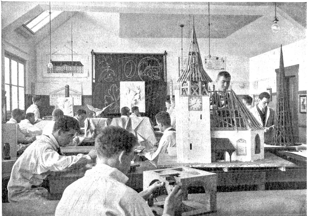
Zeichnen und Modellieren. (Abteilung für Hochbau.)

dem Vorsitz von Architekt A. Tiedhe arbeitete im Auftrag des Regierungsrates in wenigen Monaten den Plan für eine kantonale Gewerbeschule mit einer baugewerblichen, mechanisch-technischen, einer chemischen Abteilung und einem halbjährlichen Vorkurs aus. Die jährlichen Betriebskosten wurden auf 70,000 Fr., die ersten Einrichtungskosten auf