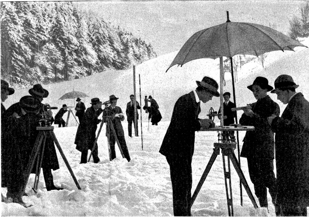
Aufnahmen im Felde durch Schüler der Tiefbau-Abteilung.

sich die verbotenen Eingänge zu industriellen Anlagen. Eine Mehrung des Reisefonds wäre eine willkommenen Stütze dieser Bestrebungen.