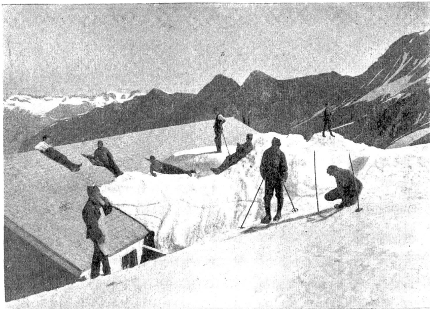
Unteroffiziersposten auf einem Grenzberg im Bündnerland.