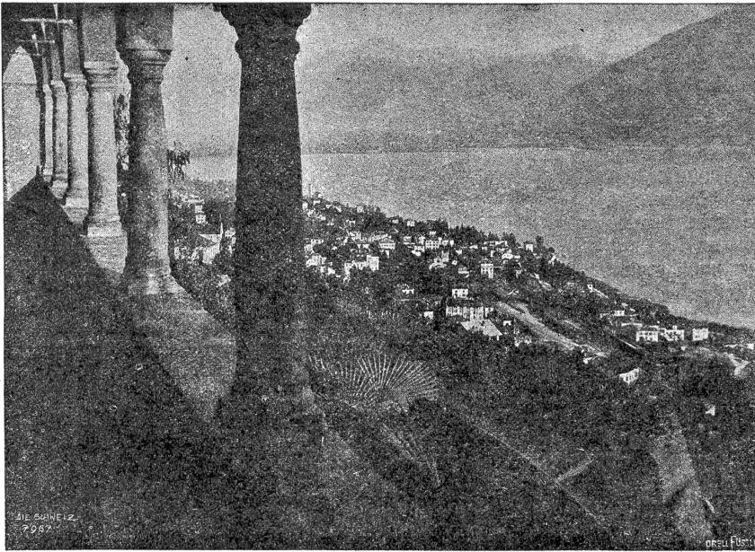
Locarno, von der Kirche Madonna del Sasso aus gesehen.

ihre einzige, ewig gleiche Geberde und sehen rührend hilflos aus in ihren Gewändern, die noch jeden Binseltstrich zeigen, mit ihren naiv unschuldigen Augen. Wie die heiligen Puppen alle heißen, ob wir sie kennen, das macht uns nichts aus. Wir werfen einen Blick in ihre staubigen Höhlen, lachen leis und erschauern in der Eislust einer verschollenen Zeit, die da herausweht. Wir husten ein leises Unbehagen heraus und steigen weiter.