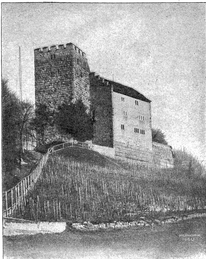
Die Habsburg, von Südwesten gesehen.

durch die Anwendung des Grundsatzes: „Divide et impera“. In einer ungarischen Hälfte beherrschte seit dem Ausgleich von 1869 die magyarische Minderheit (und innerhalb der Magnaten der Adel und die Hochfinanz) eine Mehrheit von Rumänen, Deutschen, Ukrainern, Serbo Kroaten und Tschechoslowaken. In der österreichischen Hälfte stunden Deutsche und Polen gegen Tschechen, Ukrainer, Slovenen, Italiener und Kroaten. In Bosnien eine römisch-katholische Minderheit, im Bunde mit dem mohammedanischen Großgrundbesitz zur Mehrheit geworden, gegenüber den Serbo Kroaten. In den einzelnen Landtagsversammlungen machte sich die Gruppierung gewöhnlich noch komplizierter. Die Folge dieser Zerrissenheit war eine Zunahme der Staatsohnmacht, worauf Serbien und das zarische Rußland zählten. Vielleicht wird einmal eine Statistik der Galgen von Bosnien und Galizien Aufschluß geben, wie weit diese Zersetzung schon fortgeschritten war. Franz Joseph starb in der trübsten Zeit des Nationalitätenhaders; das ist gewiß trotz allen damals angestimmten Lobfansaren; denn in jene Tage fallen die großen Ueberläufe der Tschechen ins russische und italienische Lager.