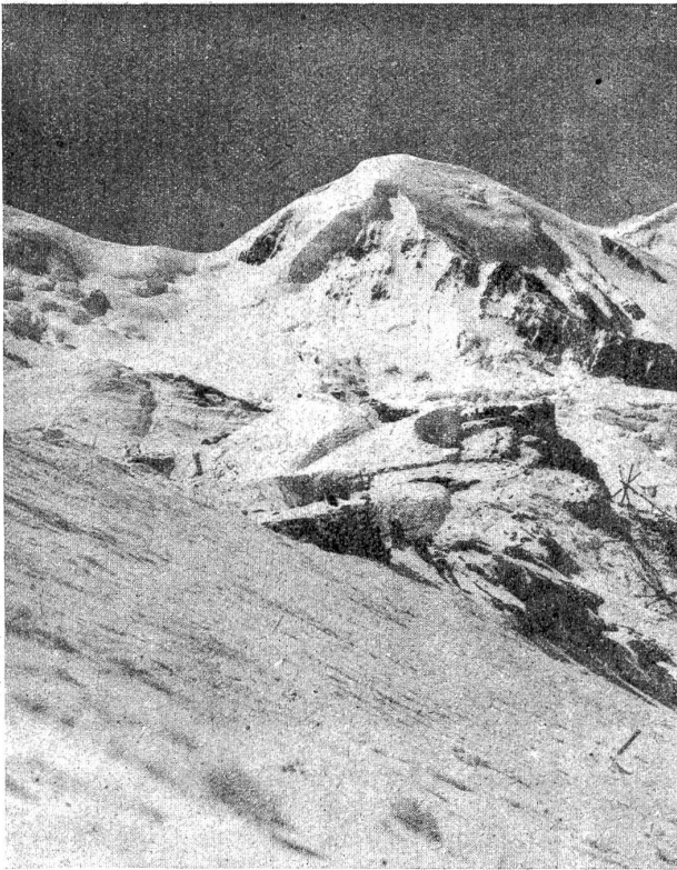
Suldenspitzerhang, Monte Pasquale und die Königsspitze.