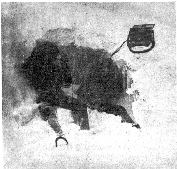
Telephonist-Beobachter im Schneesturm in einer Gletscherspalte, 3600 m hoch, am Tiroler Kampfplatz auf italienischem Boden.

Von der Dreisprachenspitze an, auf welcher die Grenzen Oesterreichs, der Schweiz und Italiens in einem Punkt zusammenstoßen und auf welcher das trotz der nachbarlich tobenden Kämpfe ganz unbeschädigte Schweizer Hotel „Dreisprachenspitze“ auf Schweizer Boden steht und der Schweizer