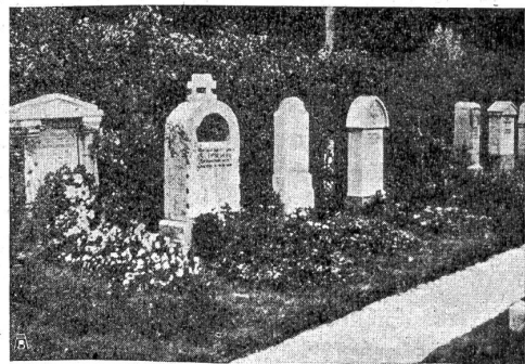
Aus dem Münchener Waldfriedhof. Die Gräber sind als flache Blumenbeete behandelt. Die Grabsteine stehen vor pflanzenhintergrund.

Die Reflexionen des Knaben gaben mir zu denken. Also auch er empfand wie ich die Absurdität des Grabmals. Er erklärte sich die Sache jedoch sehr einfach, indem er einen praktischen Zweck in der plumpen, mit Gold verbrämten Schwere des Marmors suchte, währenddem ich meine Be-