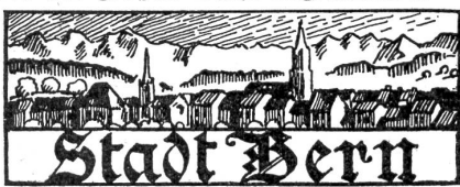
† Niklaus Luginbühl,

Belp ist die 26. Proporzgemeinde des Kantons Bern geworden. Sie hat nämlich die Initiative auf Einführung der Verhältniswahl für die Gemeindebehörden mit großem Mehr angenommen. —