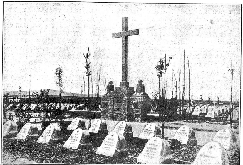
Der neue Kriegerfriedhof in Prilep (Macenonien).

„Nur eines,“ drängte Peter, „Niklas, nur eines! Ein einziges! Und ein Lump, wer mehr trinkt!“ — Sie sahen sich an. In den zwei Augenpaaren fladerte es . . . Eine