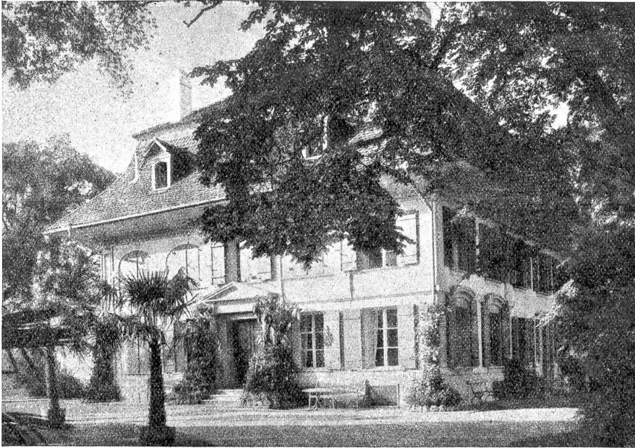
Das Herrschaftshaus in der Elfenau bei Bern.