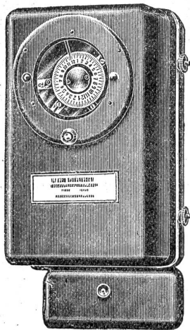
Schaltuhr zur selbsttätigen Tarifumschaltung von Doppeltarifzählern.

Die Wege und selbst die Fußsteige im Umkreise von 1—2 Stunden kannte ich so genau, daß ich mich nie verirrte.