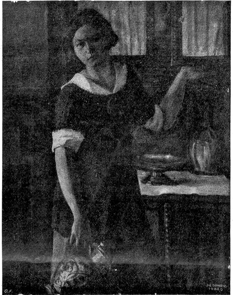
Bildebrand: Mädchen mit Krug.

Obgleich der Vater im Laufe meines Unterrichts bemüht war, alles zu vermeiden, was sich unmittelbar auf das Sehen bezog, so stieß ich doch notwendig bald hier, bald da auf diesbezügliche Ausdrücke, die meine Aufmerksamkeit weckten. Lange antwortete der Vater mir jeweilen mit nichts sagenden Erklärungen. Daran gewöhnt, mich seinem Willen zu unterwerfen, bestand ich nicht mehr darauf, sobald er gesprochen hatte. Ich hatte aber doch die unbestimmte Ahnung, daß hier irgendein Geheimnis walte.