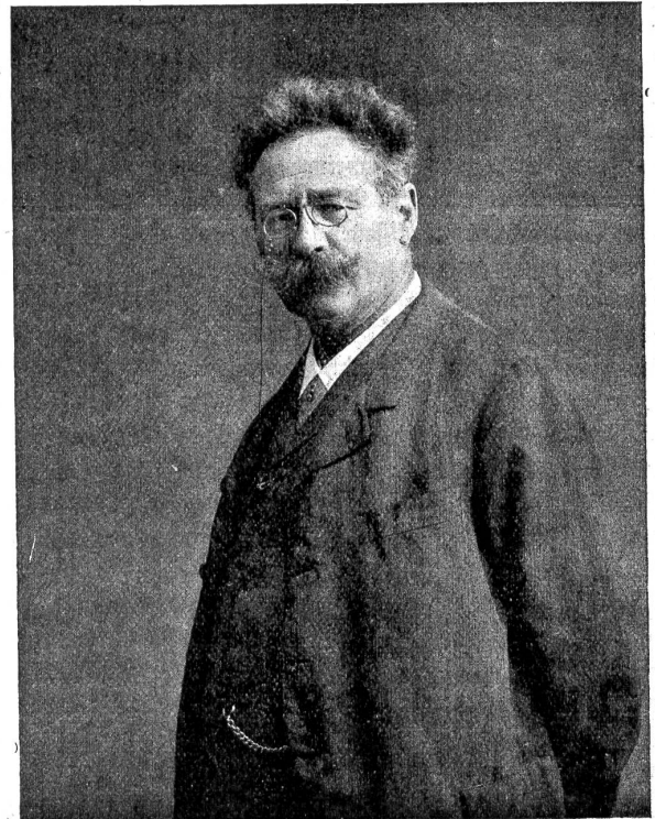
Kunstmaler Hans Bachmann (geb. 1. Mai 1852, gest. 13. Nov. 1917).

dadurch zum Hemmnis für die künstlerische Persönlichkeit. Es brauchte mehr als eine Winkelriedstat, um die durch die sogenannte Volkskunst aufgerichtete Mauer des Vorurteils und des Banalitäts zum Durchbrechen.