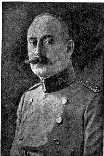
Prinz Max von Baden, der neue deutsche Reichskanzler.

Autonomie für die Nationalitäten. Die Slaven mitsamt den Polen sind durch die deutsche Not im Westen und das