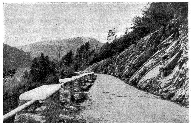
Die Kahlstrasse bei Laufen (Berner Jura).

Es gibt sehr wenig unberührte Städte in der Schweiz: Estavayer, die alten Viertel von Freiburg, Murten, Stein am Rhein und Sankt Ursitz. Und dennoch: in diesen Flecken mehr noch als in den Alpen, an den Ufern der Seen oder in der Einsamkeit der Wälder ist es, wo ich unter der Erde und unterm Stein das hundertjährige Herz unseres Landes schlagen höre. Sie sind die lebenden Zeugen von allem, was unsere Väter liebten, suchten, schufen, litten und wünsch-