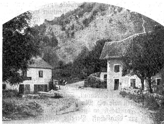
Das Dörfchen La Motte bei Ocourt, an der äussersten Grenze.

baute. Ferner Johann Senn von Münsingen: er gewährte Basel das Recht, einen Bürgermeister und einen Rat zu wählen; am 20. Juni 1351 setzte er die Vorrechte und die Pflichten des Herrschers, sowie der Vasallen in einer Charte,