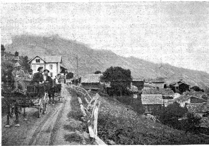
Das Dörfchen Euseigne (Ersingertal, Wallis) vor dem Brande.

Blötzlich blieb er stehen und erbleichte. Dann biß er auf die Zähne und blickte scharf und entschlossen auf eine Eiche hin. Vorsichtig schritt er näher. Das Herz klopfte ihm zum Zerpringen laut: da hinten stand einer. Vielleicht ein Häfcher. Hatte man es doch schon gemerkt, daß er fehlte? Nun, so leicht sollten sie ihn nicht fangen. Unheimlich durchbohrte sein Auge das Dunkel. Er wollte sicher sein und trat auf die Eiche zu. (Schluß folgt.)