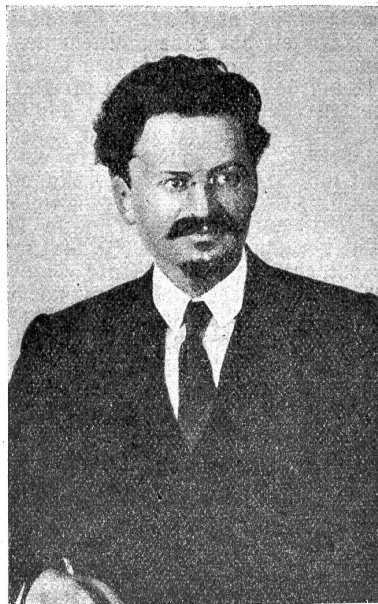
Leo Trojks, der russische Volkskommissär.