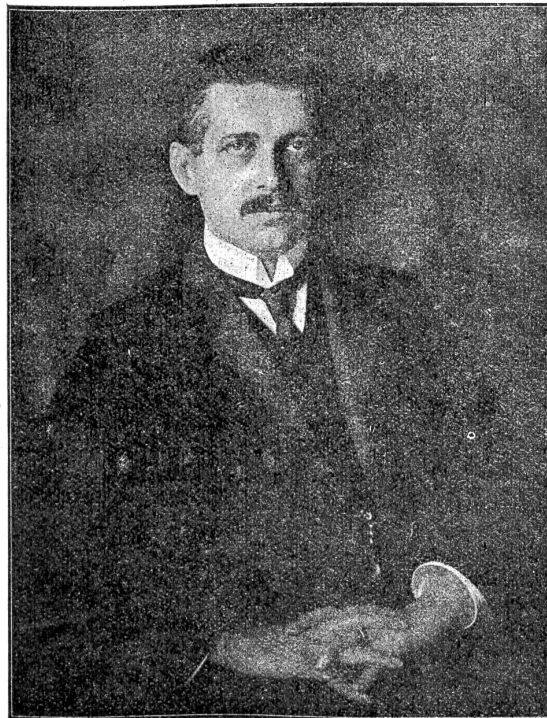
Bundesrat Dr. Robert Haab.

In Friedenszeiten gelangte das ausländische Getreide namentlich auf drei großen Zufahrtsstraßen in die Schweiz nämlich von Norden über die Rheinroute und von Süden über Marseille und Genua. Mit Rücksicht darauf hat der Bund vor Kriegsausbruch mit den beiden Nachbarstaaten, Deutschland und Frankreich, zwei Abmachungen getroffen, welche für unsere Getreideversorgung von großem Werte sein sollten: Für den Kriegsfall verpflichteten sich nämlich Deutschland die dort lagernden, für die Schweiz bestimmten Getreidesendungen nicht mit Beschlagnahme zu legen, und Frankreich, die freie