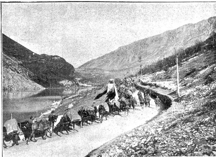
An der Plavefront: Deutsche Bagage am Lago di Morto.

Italien verlangte bekanntlich die gesicherte Ostgrenze Venetiens und stützte seine Annexionsabsichten auf das italienische Volkstum dieser Grenzgebiete. Die Mindestforderung umfaßte aber das gesamte Fsonzotal und Istrien, samt einem Landzusammenhang beider Gebiete über dem Karst und das Wippachtal. Die vorhergehenden Ausführungen mögen zeigen, wie unzureichend solche Annexionsgründe sind und wie sehr sie sich selber widersprechen. Der Kampf gegen Oesterreich als Staat wird vom italienischen Volk vielfach als ein Krieg des welschen Volkes gegen den deutschen Feind betrachtet. Natürliche Verbündete gegen die nordischen Barbaren sollen die Südslaven sein, also auch die Slowenen. Das italienische Kriegsziel geht darauf hinaus, die rein slowenischen Bergtäler des obren Fsonzo zu annektieren, geht darauf hinaus, die von Slowenen rings umgebene Handelsstadt Triest samt einem ganz slowenischen Hinterland in Besitz zu nehmen. Ein Blick