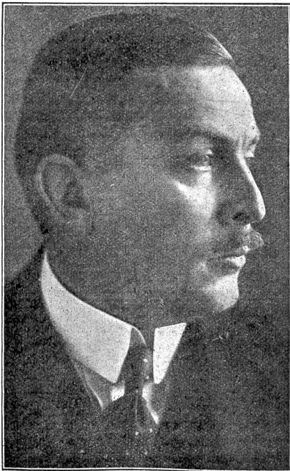
Staatssekretär des Außen von Kühlmann, Leiter der deutschen Friedensverhandlungen im Osten.

In Brest-Litowsk rangen Trojky, Czernin und Kühlmann um staatsrechtliche Grundsätze. Trojky will keinen deutsch-österreichisch-ukrainischen Vertrag gutheißen, den nicht auch die Delegation der Maximalisten von Charfow anerkennen. Er stellt sich auf den ehemals angenommenen Standpunkt, daß die Ukraine zu Rußland gehöre. Die Delegation von Kiew aber behauptet, absolut selbständig dazustehen, kraft der 4. und 5. Proklamation der Kiewer Regierung, den sogenannten „Universals“, die völlige Souveränität des Landes aussprechen. Alles kommt auf den Ausgang des Ringens in der Ukraine selber an: Eine Meldung behauptet den Fall von Charkow, eine andere Kiews Uebergang. In Südostrußland machen die Maximalisten reizende Fortschritte. Stadt um Stadt des Wolga-