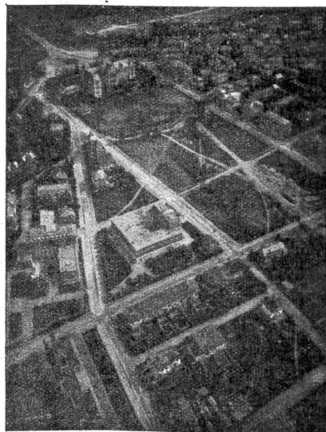
Zusammenhanglose Aufstellung öffentlicher Gebäude. Regellos bebautes Wohnquartier.

Wie dieses Schicksal von den künftigen Geschlechtern Berns abzuwehren ist, lehrt uns das Vorgehen Zürichs, Basels und anderer Schweizerstädte. Zürich befolgt seit 1911 durch einen internationalen Ideenwettbewerb die Richtlinien, nach denen es die Bebauung des Stadtareals vollzieht. Solche Bebauungspläne basieren auf dem Gedanken, daß