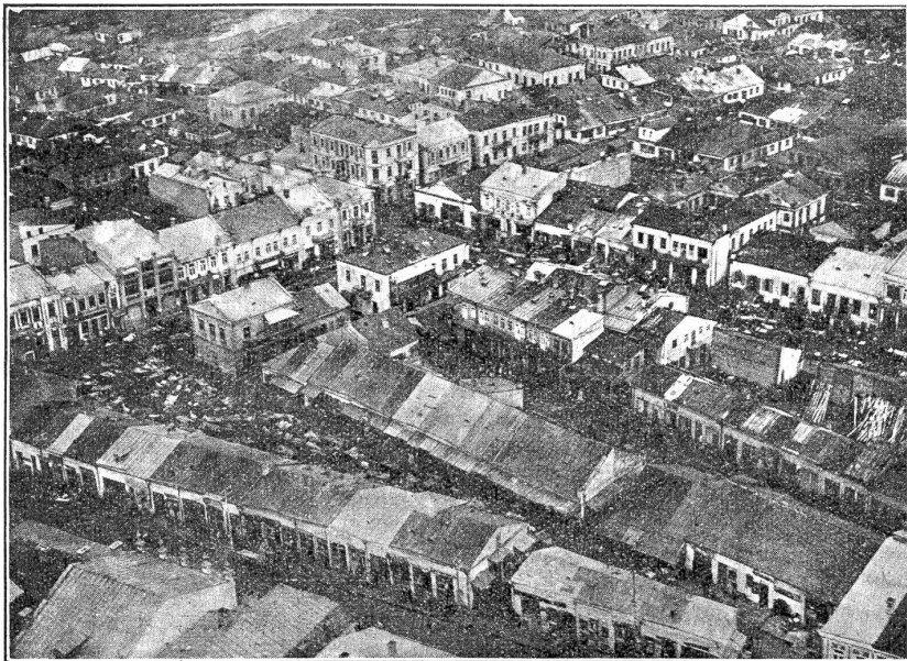
Von der Ostfront: Marktplatz der Stadt Rowno mit lebhaftem Verkehr, aus 50 m Höhe aufgenommen.

deutschen Bedingungen, die tatsächlich den vorausgesehenen entsprechen, mit 126 gegen 85 Stimmen bedingungslos angenommen: Räumung der Ostseeländer, Finnlands und der Ukraine; Wiederherstellung der früheren Handelsverträge. Die einschneidende Frage wird die der Grenzbestimmung der Ukraine sein. Hier wird die Diplomatie bestrebt sein, eine Streitfrage ähnlich der des Cholmerlandes gegenüber Großrußland zu schaffen, damit die beiden Republiken für immer entzweit seien. Um diesen Plan zu unterstützen, rücken die deutschen Truppen immer tiefer ins östliche Land hinein; fliegende Kolonnen haben schon über 300 km hinter sich. Die Linie Reval-Dorpat-Bakow-Drissa-Borissow-Kolenskowitschi-Schitomir ist erreicht. Vinsingen nähert sich auf zwei Tagesmärsche Entfernung Kiew. Im Donland aber organisiert nach Kaledins Selbstmord General Alexejew die bäuerliche Revolution gegen Lenin und Trotzki.