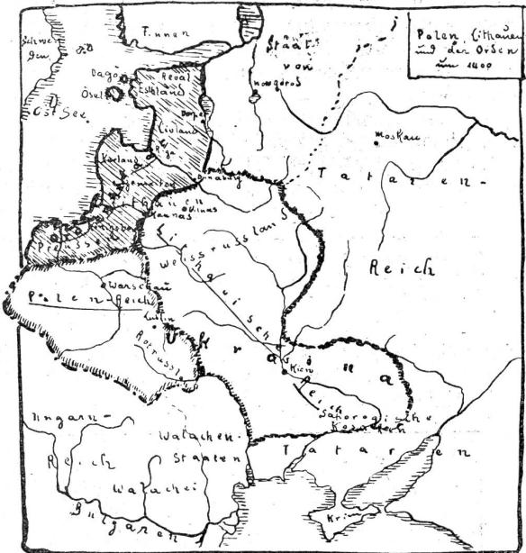
Polen, Litauen und der Orden um 1400.

Völker nie. Alle andern acht Gruppen erfüllten eine Zeitlang die Welt mit ihrem Lärm. Die neunte allein sieht eingekleidet zwischen Slaven, Germanen — (Deutsche, Polen, Russen) — und Finnen und scheint unterzugehen . . . .