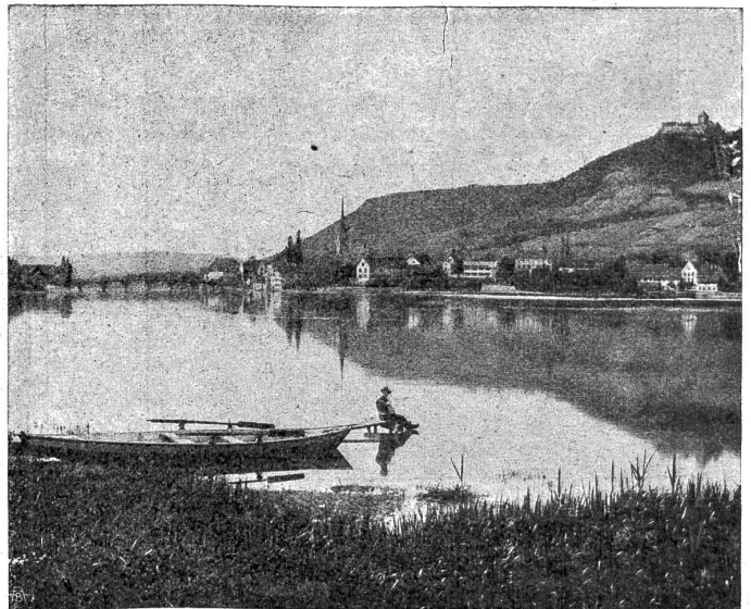
Stein a. Rh. vom Fluß aus gesehen.

Die ersten Fremdlinge, die in das Land einbrachen, waren die deutschen Schwertbrüder, eine christliche Rittergesellschaft, gegründet zum Zweck der Eroberung irgend eines „heidnischen“ Landes. Sie faßten festen Fuß in Livland, das ihnen bis 1237 gehörte und arbeiteten den deutschen Ordensrittern vor. Der deutsche Orden arbeitete in Preußen vielleicht fünfzig Jahre an der Eroberung und faßte dann in Kurland Fuß, erbt die Trümmer des Schwertbrüderstaates, dann 1346 auch Esthland. 1384 eroberte er das litauische Szemaiten („Niederland“, sprich Schemaiten) mit Kaunas. Um 1400 stund der Ordensstaat in höchster Blüte. Man suche auf der Karte und denke sich als geographische, staatliche unabhängige Einheit die heutigen Länder West- und Ostpreußen, Szemaiten, Kurland, Livland und Esthland. Die innere Verfassung des Staates glich aufs Haar der türkischen. Statt des Sultans hieß der Führer des Herrenvolkes Großmeister. Wie die Türken über die Christenvölker, so setzten sich die Ordensritter über die baltischen Heiden als Adel, verteilten Land und Leute unter sich als Beute und genossen die Früchte fremder Arbeit. So sah