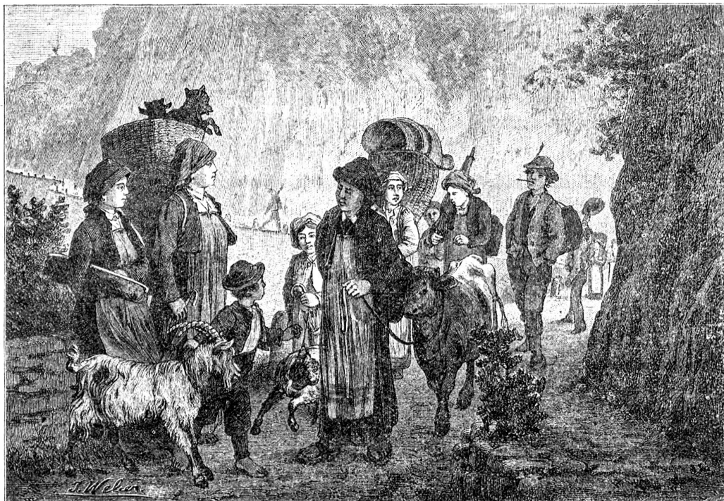
Marktleute aus Verzasca.

„Nein, du brauchst heute nicht zu gehen. Sie kann einen andern schicken.“