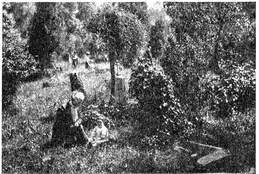
Aus dem ehemaligen Rosengartenfriedhof in Bern.