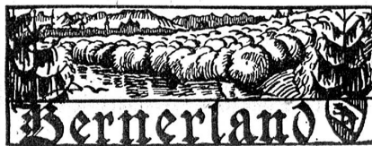
† Rudolf Käser,

Frankreich soll der Schweiz mitgeteilt haben, daß alle jene Verpflichtungen, welche Schweizerfirmen, die auf einer schwarzen Liste der Entente standen, anläßlich ihrer Rehabilitierung in bezug auf ihren Verkehr mit den Zentralmächten einzugehen hatten, nunmehr als dahingefallen betrachtet werden.