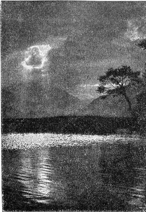
Malerische Landschaft am Thunersee.

An einem goldenen Herbsttage fuhren wir mit der See-Strandbahn, der „Rechtsufrigen“, wie sie der Volksmund