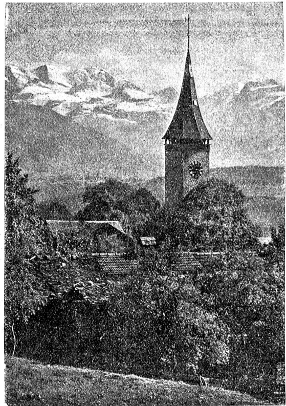
Kirche in Bülterfingen.

von unten bis oben weder Fenster noch eine andere Öffnung und diente wahrscheinlich als Wachturm. Der Turm der alten St. Ursuskirche, welcher im Jahre 1360 gebaut wurde, nachdem zwei ältere Türme vier Jahre vorher beim Erd-