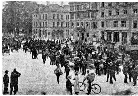
Vom Berner Wochenmarkt: Der „Säulimarkt“ auf dem Waisenhausplatz.

Wer in diesen schönen Herbsttagen über unsere Berner Marktplätze läuft — vom Säulimarkt auf dem Waisenhausplatz her über den Bärenplatz und den Parlamentsplatz mit dem Frühlings- und Gemüsemarkt, die Marktplätze hinunter zum Frühlingsmarkt an der Kehlergasse usw. — der erhält unbetreitbar den Eindruck, daß wir in guten Tagen leben: Das Marktbild ist belebt, es werden viele Waren angeboten und es wird viel gekauft. Der Herbst ist ein fruchtbarer; das beweisen die vollen Körbe der Frühlingshändler; die Bodenprodukte sind prächtig geblieben; die Kartoffeln insbesondere sind heuer zur Freude alles Volkes geraten, wie selten in einem Jahr. Das vermehrte Angebot hat auch schon etwelchen Einfluß auf die Marktpreise ausgeübt, wenn auch nicht im Sinne einer wesentlichen Reduktion, so immerhin im Sinne einer Stabilisierung. Dies als momentaner Eindruck für den Gemüths- und Frühlingsmarkt festgehalten; im übrigen beweist die Statistik, daß die Teuerung