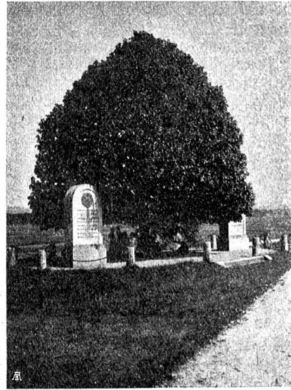
Linde bei den Denksteinen zur Erinnerung an den Sieg der Berner über die Gugler (1374) und an die Niederlage von 1798 bei Fraubrunnen, Kanton Bern.

ren Vorschlägen an die Ortsbehörden weiter. Das Zirkular der St. Galler Sektion weist darauf hin, „daß wir an einem Wendepunkt der Geschichte stehen, der es wohl wert ist, in