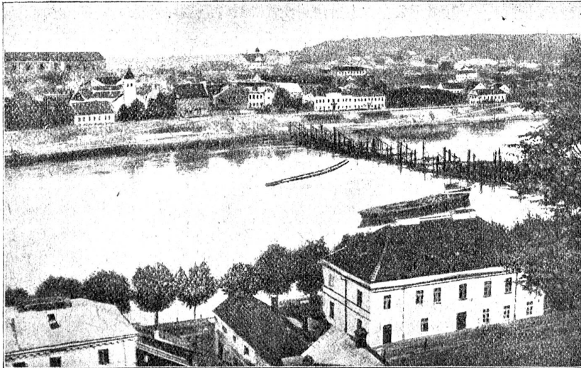
Kaunas (Kowno) mit dem Nemunas (Njemen).