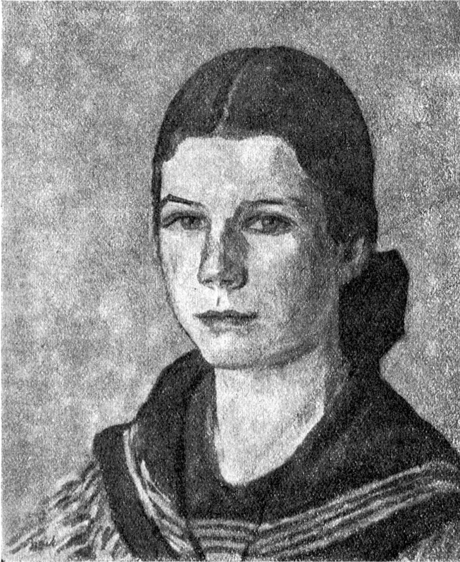
Max Brack: Mädchenkopf. (Aus dem Kunstsalon Ferd. Wyß, Zeitglocken 4, Bern.)