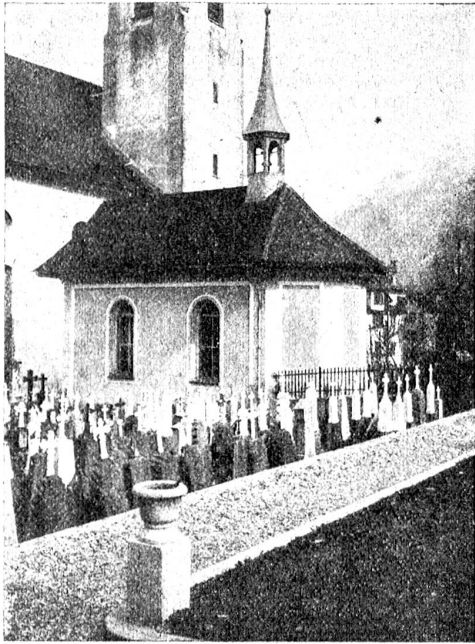
Grabsteinschmuck: Schlechtes Beispiel.

diesem Augenblick die Hand entgegenstrecken dürfte? Sehr herzlich kann ich es zwar nicht tun; denn ich habe selber den festen Stand im Leben noch nicht recht wieder gefunden.