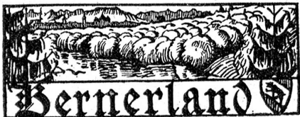
† Dr. Victor Dh, gewesener Arzt in Bern.

Der eidgenössischen Unfallversicherung in Luzern werden zurzeit 33,000 versicherungspflichtige Betriebe mit 600,000 bis 700,000 Arbeitern angeschlossen. Der Personalbestand beträgt 527 Beamte oder einen Beamten auf 65 Betriebe, 800 Unfälle und 1400 Versicherte. —