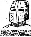
FIG. 9. TOPFHELM M. EISENEM ABSCHLUS.