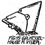
FIG. 15. GR. HESEL-HEUBE M. VISIER.

„Ich hab meine Frau ermordet.“ Und er erzählt in hastigen Worten und abgerissenen Sätzen, was er vorhin erlebt hat. „Es kann kein Traum gewesen sein, denn droben sagte meine Frau gerade das, was mir vorhergesagt worden war.“