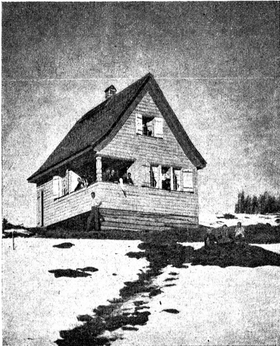
Das neue Bergheim auf Dürrentannen im Ganteristgebiet.

Fast zuoberst auf dem Dürrentannengrat, zwischen den ausichtsreichen Vorbergen der Pfeife und Schöpfenfluh, hockt fest und kühn das heimelige Hüttlein. Neugierig steckt es seinen spitzen Giebel in die Luft. Etwas feiner und zarter gebaut als seine Nachbarinnen, hat es doch im furchtbaren Föhnsturm kurz nach Neujahr bewiesen, daß es das raube Bergklima ertragen kann. Prächtigt paßt es in seine Umgebung; aber erst, wenn sein neuer Schindelmantel, der es vom Kopf bis zu den Füßen schützend umgibt, von Sonne und Regen silbergrau gebeizt sein wird, kann es als würdiges Mitglied in das Bürgerrecht der Gantristgemeinde aufgenommen werden. — Die Aussicht von seinem sonnigen Läubli allein schon macht dir das Hüttchen zum steten Freund. Ein Teil der Hochalpen im Osten, dann die ganze stolze Reihe der Berner und Freiburger Boralpen von der Wirtneren bis zur Kaiseregg und ganz im Westen die edel-