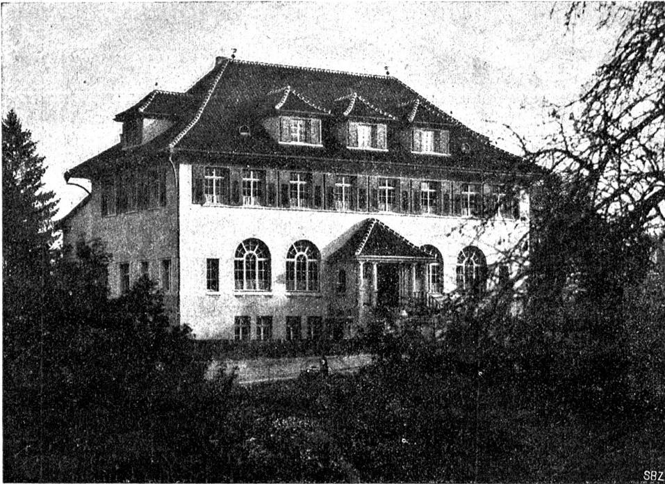
Das Volksheim zum „Rosengarten“ in Chalwil; Ansicht von Westen.

nicht so einfach und nicht ohne weiteres auszuführen sei. Er müsse zuerst die Priesterweihe empfangen, das sei gewissermaßen die Pforte, durch die er in das gelobte Land eingehen könne.