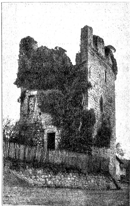
Hexenturm in Sempach.

der Stadt. Am stillsten ist's in den wenigen Nebengäßlein, wo nur Hühner herumspazieren. Sempach ist also heute