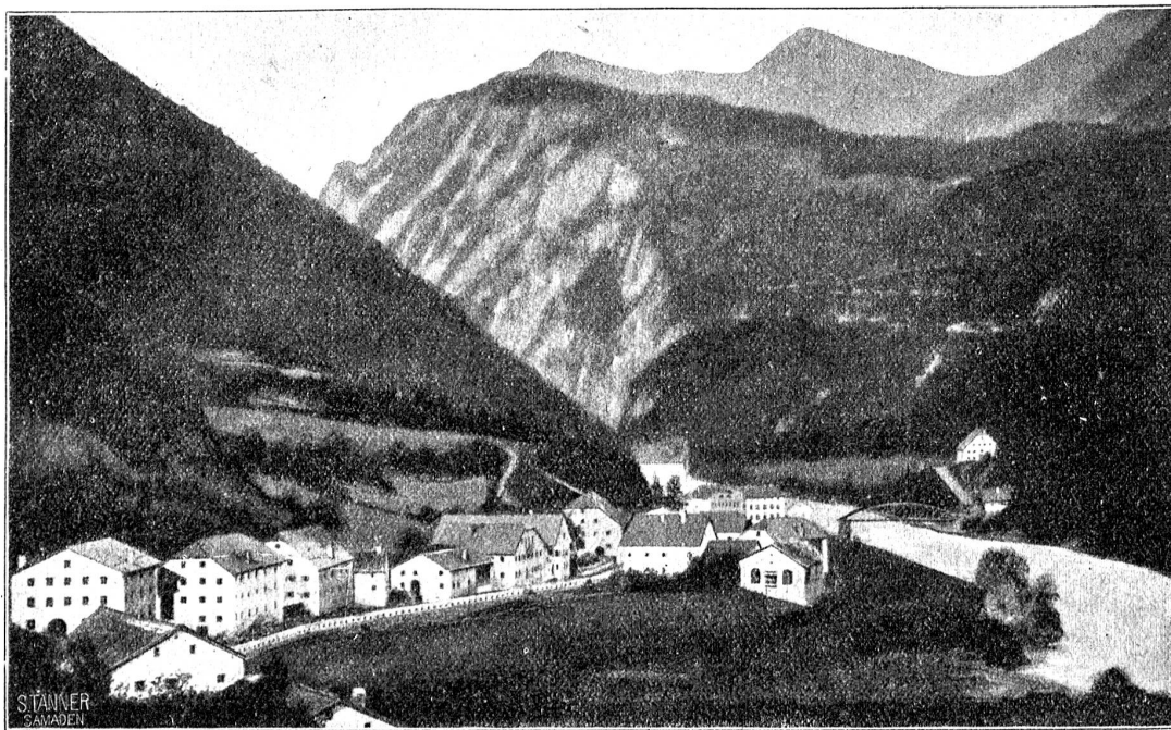
Im Unterengadin: Martinsbruck, der Grenzort

weniger als sauber. Der Soldat stand lange Monate an der russischen Front, wurde schwer verwundet und hält nun, weil zum Frontdienst nicht mehr tauglich, an diesem ruhigen Grenzstück Wache und kontrolliert, wie er lachend versichert, alle Wochen einmal eine Paßkarte und läßt sich dazwischen gar zu gerne Schweizerstümpfen schenken. Der Grenzverkehr ist sozusagen vollständig unterbunden. Die bitteren Worte, die der Soldat über seine Regierung fallen ließ, sind mir erst seither in ihrer ganzen Bedeutung inne geworden.