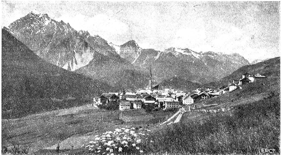
Im Unterengadin: Sent an einem Junitage.

Remüs ist einer jener Orte, die zu verschiedenen Malen der verheerenden Wirkung großer Dorfbrände zum Opfer fielen, zuletzt 1880. Fast alle Häuser sind deshalb neueren Datums. Im windgeschützten Kessel gedeihen die ersten Obst-