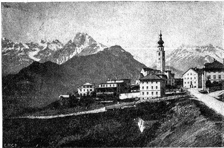
Im Unterengadin: Zetan, das Hochterassendorf.

fröhlich knallen, Junge. Bind deine Schürze besser um, Mädchen, sonst verlierst du sie beim ersten Zug. Nimm die andere Gabel, du, nicht daß dir die eine Zinke gleich abbricht, sie ist gar schwach und du lädst gar schwer. Gib sie dem Knechtlein, für den ist sie gerade recht. Da sind wir, marsch, herunter vom Wagen. Jetzt muß es laufen.“