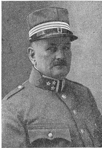
† Oberst Ernst Ruchti.

folgendes entnehmen: Herr Oberst Ernst Ruchti wurde im Jahre 1865 in der Narberberggasse in Bern als jüngstes von