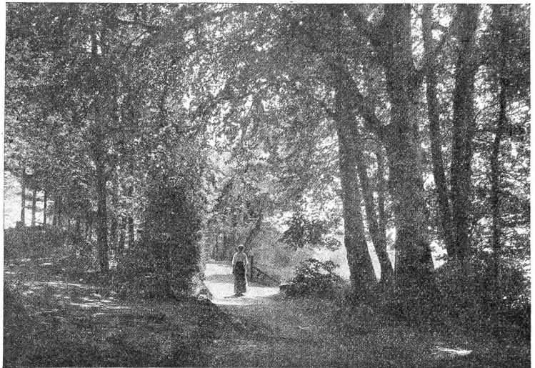
Waldweg zum Garten.

Wir möchten unsern Bericht mit einer kleinen Anregung zuhanden der Anstaltsleitung und unserer Leser schließen. Wer hat sich nicht schon gefragt angesichts der Massen von Kränzen und Blumen, die von innerlich recht unbeteiligter Seite in ein Trauerhaus gesendet wurden, ob für das solchermaßen gedankenlos verschwendete Geld nicht eine bessere Verwendung am Platze wäre? Stirbt da irgend ein Politiker oder Geldmensch mit einem riesigen Vereins- und Bekanntenanhang: sein Leichenzug füllt die Straßen der Stadt, für Tausende werden Kränze nachgetragen — ein Schauspiel für neugierige Gaffer — oft ein Vergernis für seine politischen Feinde und Neider. Anderswo stirbt ein heldenhaftes armes Frauelein von seinen Kindern weg — einige dürftige Kränzlein von der Liebe gesendet folgen ihm zum Grab. Wir fragen: Ist jenes Kränze-Schaugespränge, jene Propaganda des Klassenhasses oder des Mammonsdienstes auf dem Gang zum Grabe nicht ein verachtungswürdiger Anflug? Und ist dieses schlichte Abschied-