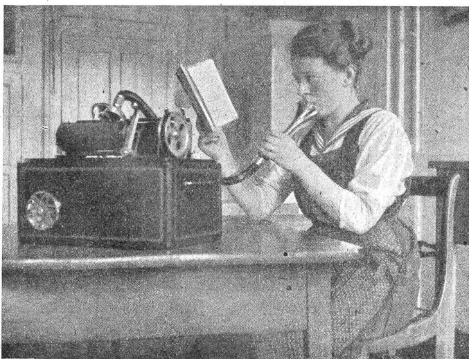
Am Parlograph: Diktat.

Ich habe mir nunmehr fest vorgenommen, alle Jahre hierher zu kommen. Es ist halt alles viel zu schön, um es in einem Male auskosten zu können. — Immer wieder wünschte ich in diesen Tagen, doch einige meiner Freunde bei mir zu haben, damit wir uns in all das Schöne und Gute hätten teilen können. Diesen Wunsch habe ich überhaupt immer, wenn ich allein bin, um etwas Großes und Unvergessliches zu genießen. — Ich habe nun auch die Zimmer — man kann schon fast sagen Gemächer —