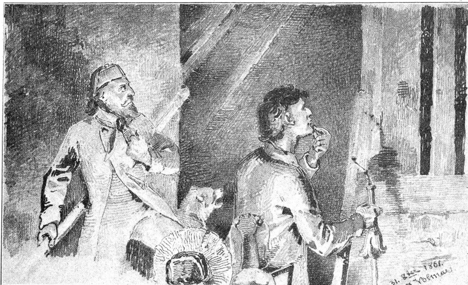
J. Volmar: Spukhaftes aus Bern-Altstadt. Das Geräusch im Frienisbergerhaus.

fehlen, so erzählen Sie uns ein wenig, wer Sie sind und woher, und was Sie da auf Reisen suchen.“