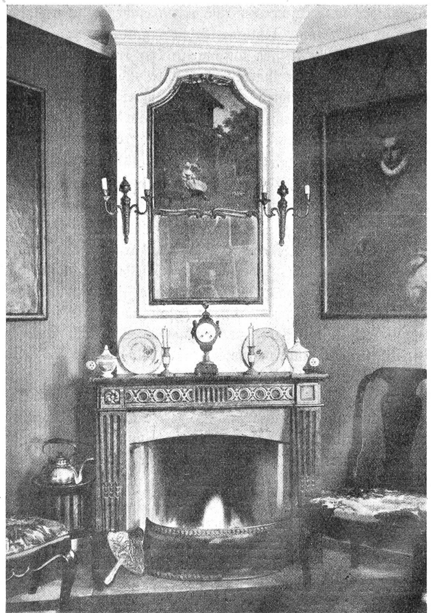
Monrepos: Kamin im Esszimmer.