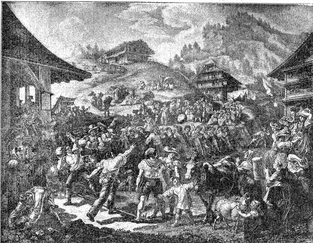
Ludwig Vogel (1788—1879). Steinstossen auf Rigi-Klösterli am St. Magdalentag. Nach dem Ölgemälde von 1823.